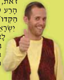
שבת שלום, טוביה

האמת היא שהמצב מצוין, כי מדינת ישראל היא הכי טובה בעולם! היא המתנה הכי גדולה שבורא עולם נתן לנו בדור הזה! אז למה לפעמים מדברים בהדשות על כל מיני צרות ובעיות? כי לפעמים יש לנו יצר להסתכל דוקא על הדברים הלא טובים, על הקשיים והבעיות. אנוחנו קצת נהנים להתלונן... אבל זה לא נכון, הפל טוב! כמה נסים ה' עושה לנו כל הזמן, כמה הוא מציל אותנו, מחייה אותנו ועוזר לנו! איזו מדינה חזקה יש לנו, איזו ארץ נפלאה! בפרשת השבוע פרשת 'שלח', אנוחנו קוראים על החטא הגדול ביותר שקטאו בני ישראל במדבר: חטא המרגלים. המרגלים היו ראשי השבטים שגשלו על ידי משה לתור את הארץ, והם היו אומרים לחזר ולספר לבני ישראל כמה הארץ טובה ויפה. במקום זאת, הם דברו לשון הרע על ארץ ישראל הקדושה, וגרמו לבני ישראל לפחד להכנס לארץ (חוץ מקלב בן-נפנה ויהושע השתתפו בצעה