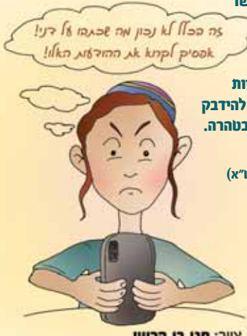
צויר: חגי בן הרוש

(מתוך הספר: "לשמע את דברי ה' מפי הרב ניר בן ארצי שליט"א)